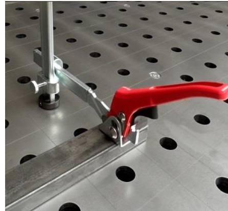
Bilder: Anwendungsbeispiele Aufsteckspezialspanner Ø 28